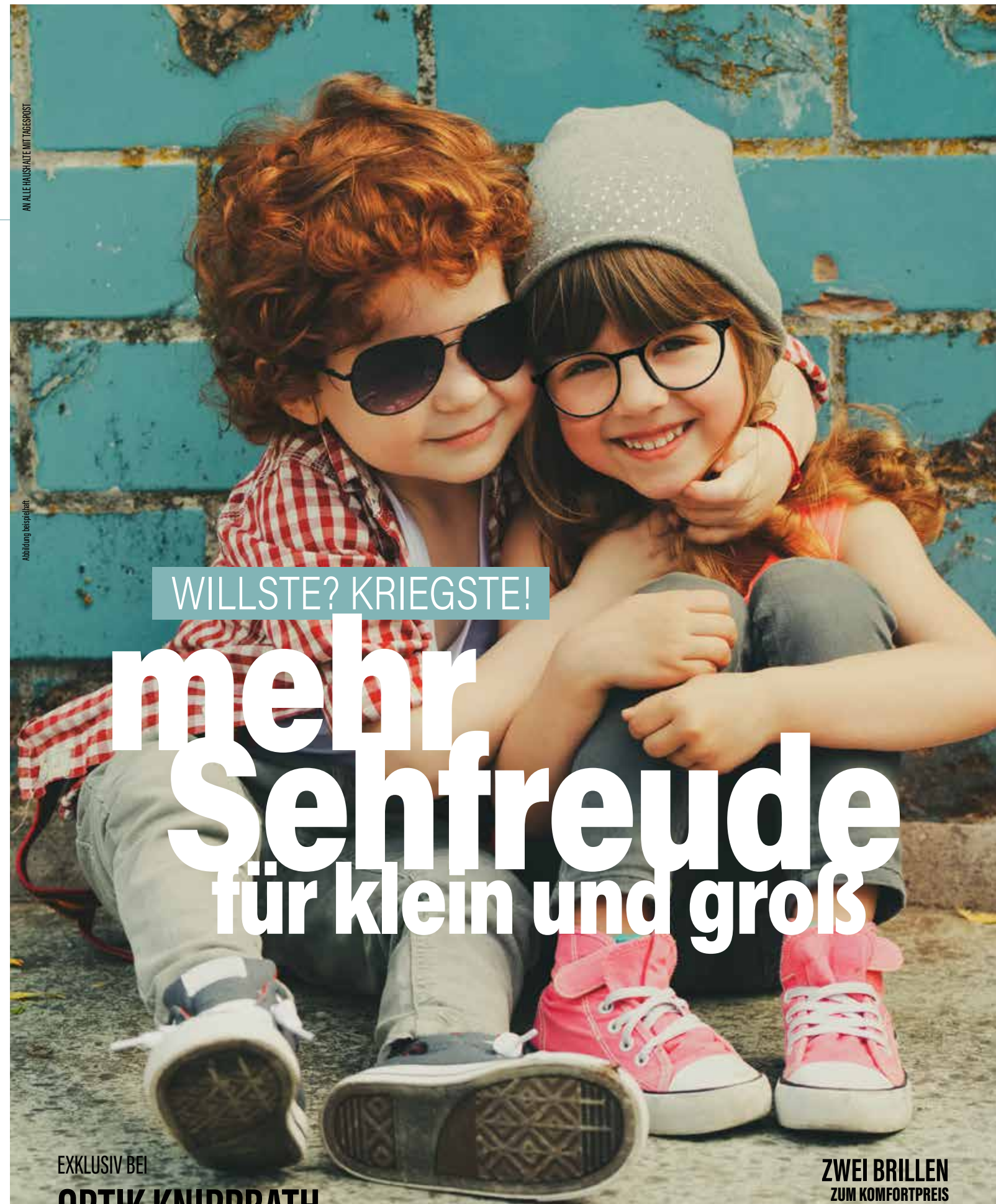
AN ALLE HAUSHALTE MIT TAGESBRIST

REGIONAL EINKAUFEN, WEIL WIR MEHR ALS BRILLE SIND!